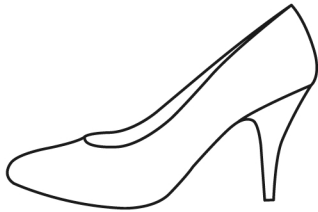
女性用ハイヒール